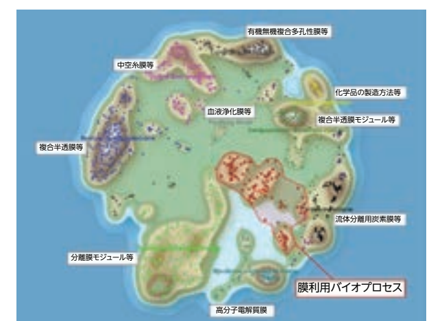
分離膜技術関連特許のランドスケープマップ(各点:東レグループの特許)

これらの内「膜利用バイオプロセス」の分野では、膜技術とバイオ技術を融合させて、非可食バイオマスから高効率・低エネルギーで非可食糖や化学品を製造するバイオプロセスの研究を推進し、タイでは技術実証と事業化検討を行っています。それに伴い、関連特許(赤点)を数多く取得しており、化石資源に頼らない社会の実現に貢献していきます。